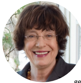
Manne Lucha , Minister für Soziales und Integration

Viele Menschen in Baden-Württem- berg bringen sich ein, um ihr Lebensumfeld zu gestalten. Dabei